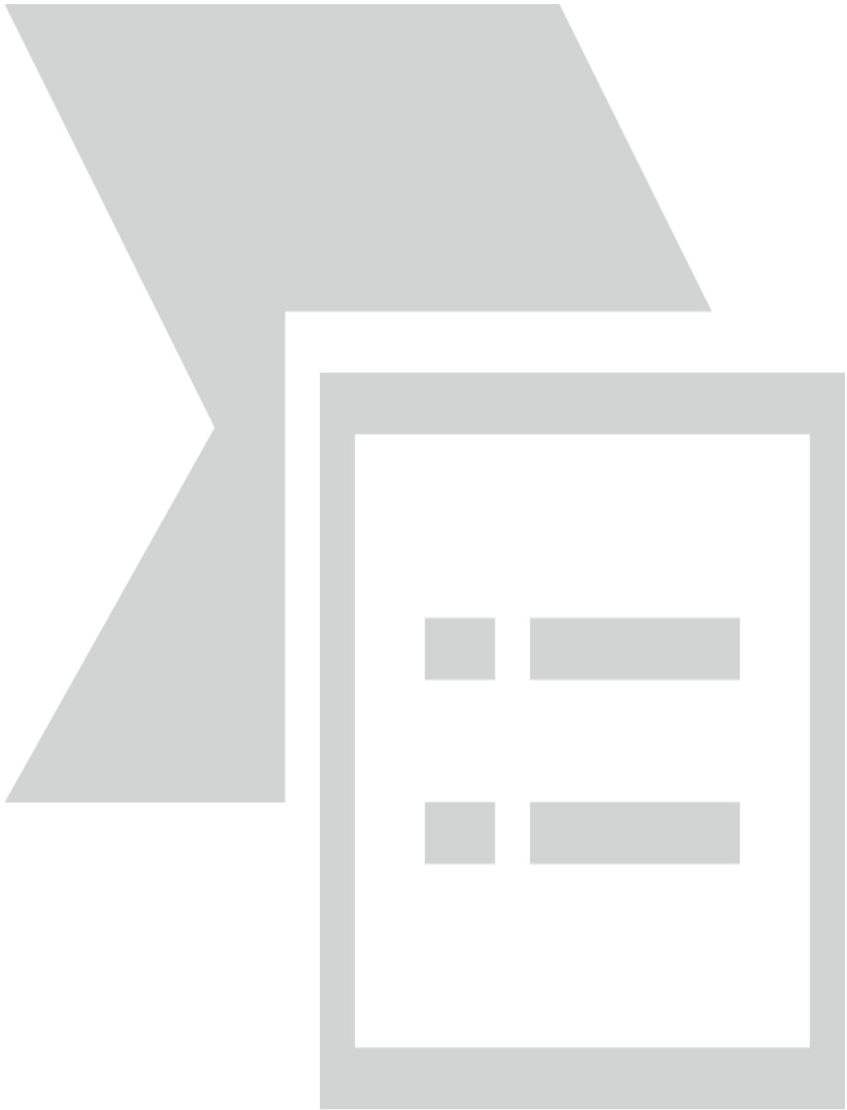
Приложение № 13 към чл. 21, ал. 2